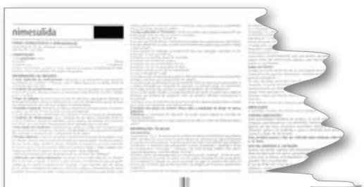
Veja as bulas atuais

Informações mais claras, linguagem objetiva e conteúdos padronizados. Estas são algumas características das novas bulas de medicamentos, regulamentadas pela Anvisa (Agência Nacional de Vigilância Sanitária), por meio da Resolução RDC 47/09. A medida foi publicada no "Diário Oficial da União", no dia 9 de setembro de 2009.