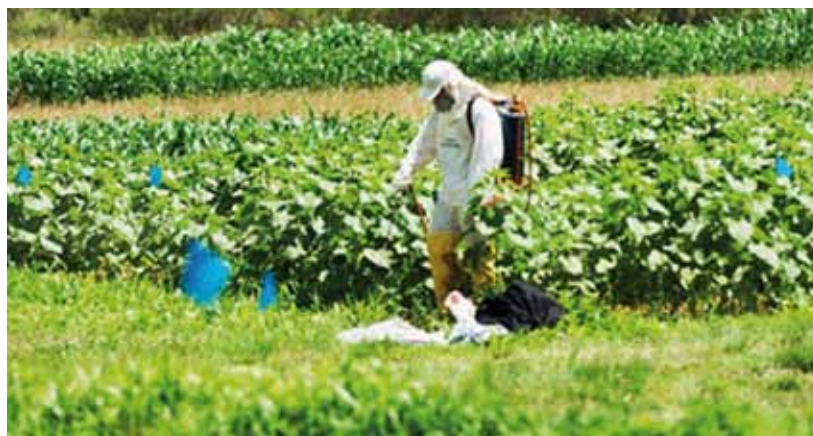
Os agrotóxicos foram desenvolvidos para dificultar ou exterminar formas de vida. Justamente por essa característica, são capazes de afetar a saúde humana

PLANO DE VIGILÂNCIA – O Ministério da Saúde, ainda, criou, em 2007, o Grupo de Trabalho para a