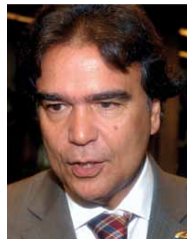
Ministro da Saúde, José Gomes Temporão: “Momento de reafirmação da boa tradição da qualidade técnica e científica brasileira”.

O Instituto Evandro Chagas já compõe a rede de 147 Centros de Referência Mundial em Vírus da Organização Mundial da Saúde (OMS), que monitoram de antigas a novas doenças. Como exemplo recente dessa atu-