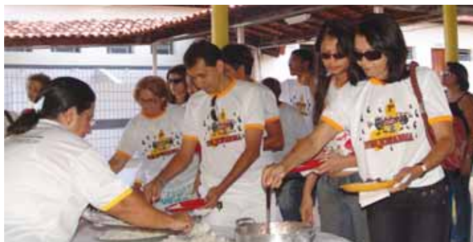
Feijofarma marca a recriação da entidade

efetivo do Conselho Estadual de Saúde. A conquista já ajudou a mudar a opinião pública sobre a profissão.