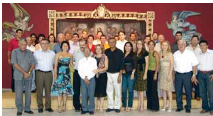
Associados e diretores posam para foto histórica, na sede da Associação dos Farmacêuticos Piauiense

Em um ano de funcionamento, um dos grandes ganhos contabilizados pela Associação Farmacêutica foi a participação de um dos seus membros como membro