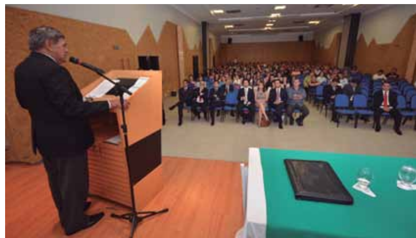
Presidente do CFF, Walter Jorge, faz primeiro discurso aos farmacêuticos conterrâneos: "Compartilhar conhecimento e capacitar o farmacêutico é uma das principais bandeiras de minha gestão à frente do CFF".

paraenses. Eles fazem parte dela. O XI Ciclo de Conferências em Ciências Farmacêuticas é um evento multidisciplinar e repleto de possibilidades de troca de experiências e cooperações técnicas e científicas entre profissionais. Compartilhar conhecimento e capacitar o farmacêutico é uma das principais bandeiras de minha gestão à frente do CFF", afirmou o Presidente.