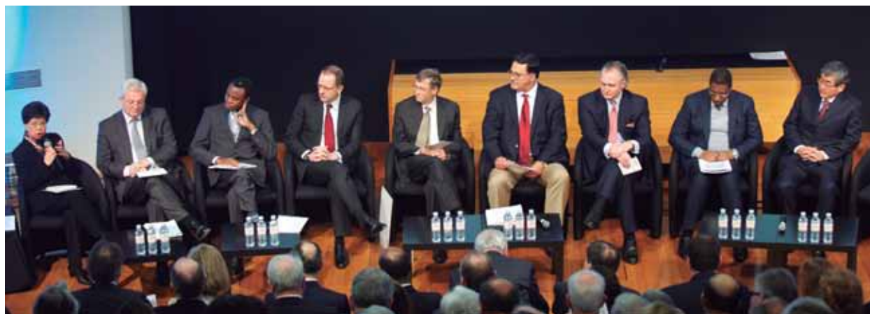
Reunião dos dirigentes de empresas e organizações para assinatura de acordo para o combate de doenças negligenciadas. Entre eles, estão Bill Gates, magnata e filantropo norte-americano, fundador da Microsoft (quinto da esquerda para a direita). Ao seu lado esquerdo, encontra-se o Diretor Executivo da GSK, Andrew Witty

A GlaxoSmithKline (GSK) uniu-se a outras empresas farmacêuticas globais e organizações líderes, incluindo a Organização Mundial da Saúde (OMS), a Fundação Bill e Melinda Gates, o Departamento de Desenvolvimento Internacional do Reino Unido e a Agência dos Estados Unidos para o Desenvolvimento Internacional (USAID), em um novo esforço conjunto para apoiar os países em desenvolvimento a eliminar doenças tropicais negligenciadas (NTDs - sigla em inglês). As NTDs afetam mais de um bilhão de pessoas, em países em desenvolvimento, causando doenças, incapacidade e morte, e aumentando a carga sobre os sistemas de saúde sobrecarregados.