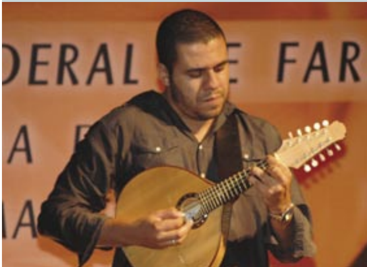
O músico Hamilton de Holanda executa o “Hino Nacional Brasileiro” ao bandolim