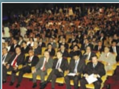
Auditório do Memorial JK lotado durante solenidade do Dia do Farmacêutico