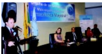
Solenidade movimentou o setor magistral do DF

Cento e oitenta farmacêuticos especializados em manipulação de medicamen-