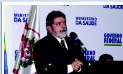
O presidente Lula discursa na solenidade do Dia Mundial da Saúde, no Instituto Butantã