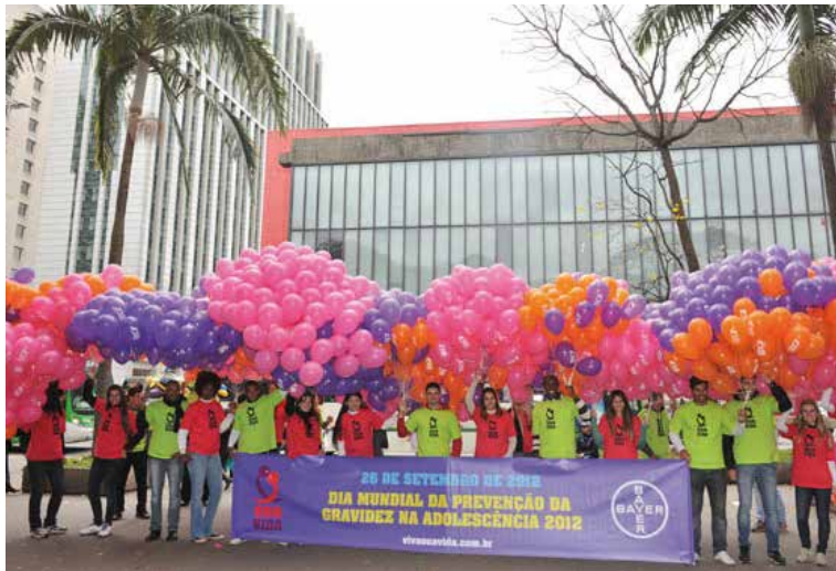
Baner com o logotipo da Bayer em uma atividade do Dia Mundial da Contraceção ( World Contraception Day )