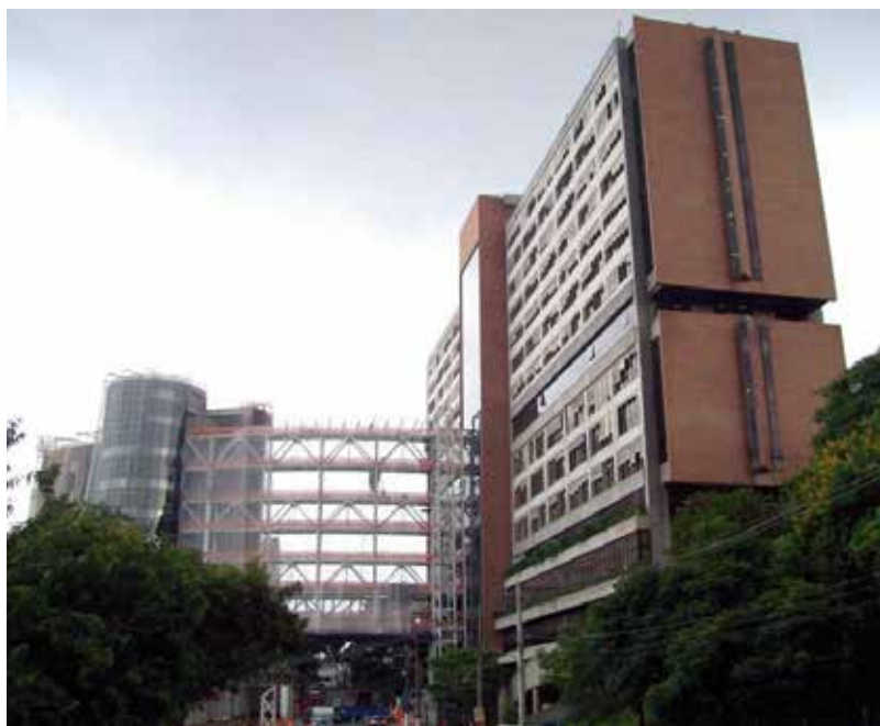
O hospital privado Albert Einstein, em São Paulo, é considerado um dos melhores hospitais do Brasil.

Nos hospitais e consultórios privados, os médicos recebem representantes das companhias