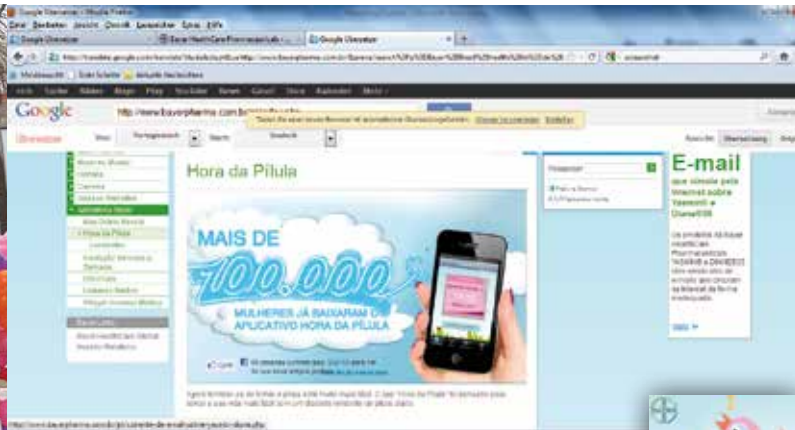
Bayer – melhor escolha em matéria de contraceção?

destinada a melhorar o acesso ao medicamento antiparkinsoniano Sifrol® por longo prazo. Em cinco anos, o conhecimento e a tecnologia relativos à produção do medicamento serão repassados para um laboratório oficial. Até que isto ocorra, a Boehringer Ingelheim permanecerá como o único fornecedor do medicamento no sistema público de saúde. Antes disso, o Instituto Nacional da Propriedade Industrial (INPI) havia negado uma extensão do termo de patente do Sifrol®. Cerca de 220.000 brasileiros sofrem da doença de Parkinson e podem se beneficiar deste caro tratamento. 10