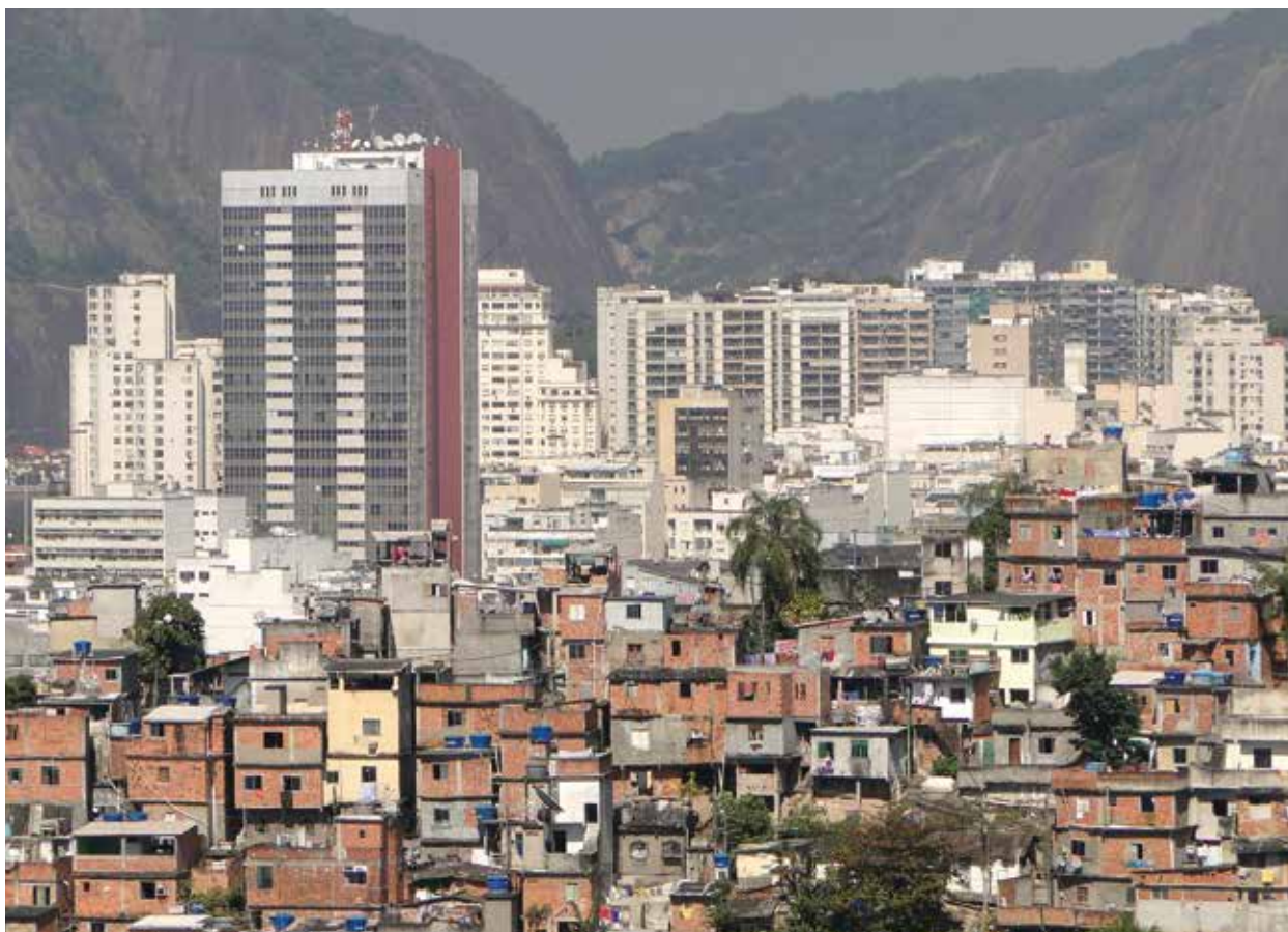
Favela e arranha-céu

medicamentos. 18 Apenas pouco antes da data de impressão desta brochura as companhias Bayer e Boehringer Ingelheim nos enviaram listas de todas as patentes e pedidos de patente sobre os medicamentos comercializados no Brasil. A Boehringer Ingelheim detém uma patente sobre o Pradaxa® (etexilato de dabigatrana). A Bayer detém patentes sobre o medicamento essencial Avalox® (moxifloxacino), o Levitra® (vardenafila) que é principalmente usado como medicamento de estilo de vida, o contraceptivo racional Mirena® (levonorgestrel), assim como os contraceptivos irracionais contendo drospirenona, Yaz® e Yasmin®. Além disso, há um pedido de patente para o antineoplásico Nexavar® (sorafenibe). 19 No Brasil, o pedido de patente foi inicialmente rejeitado. Contudo, a Bayer contestou e a decisão final da corte ainda não foi estabelecida. 20 O fabricante defende o elevado preço para o antineoplásico com os altos custos de pesquisa. Todavia, a substância ativa sorafenibe sequer foi desenvolvida pela própria Bayer, mas por uma pequena companhia, por meio de um contrato de pesquisa. Após seu