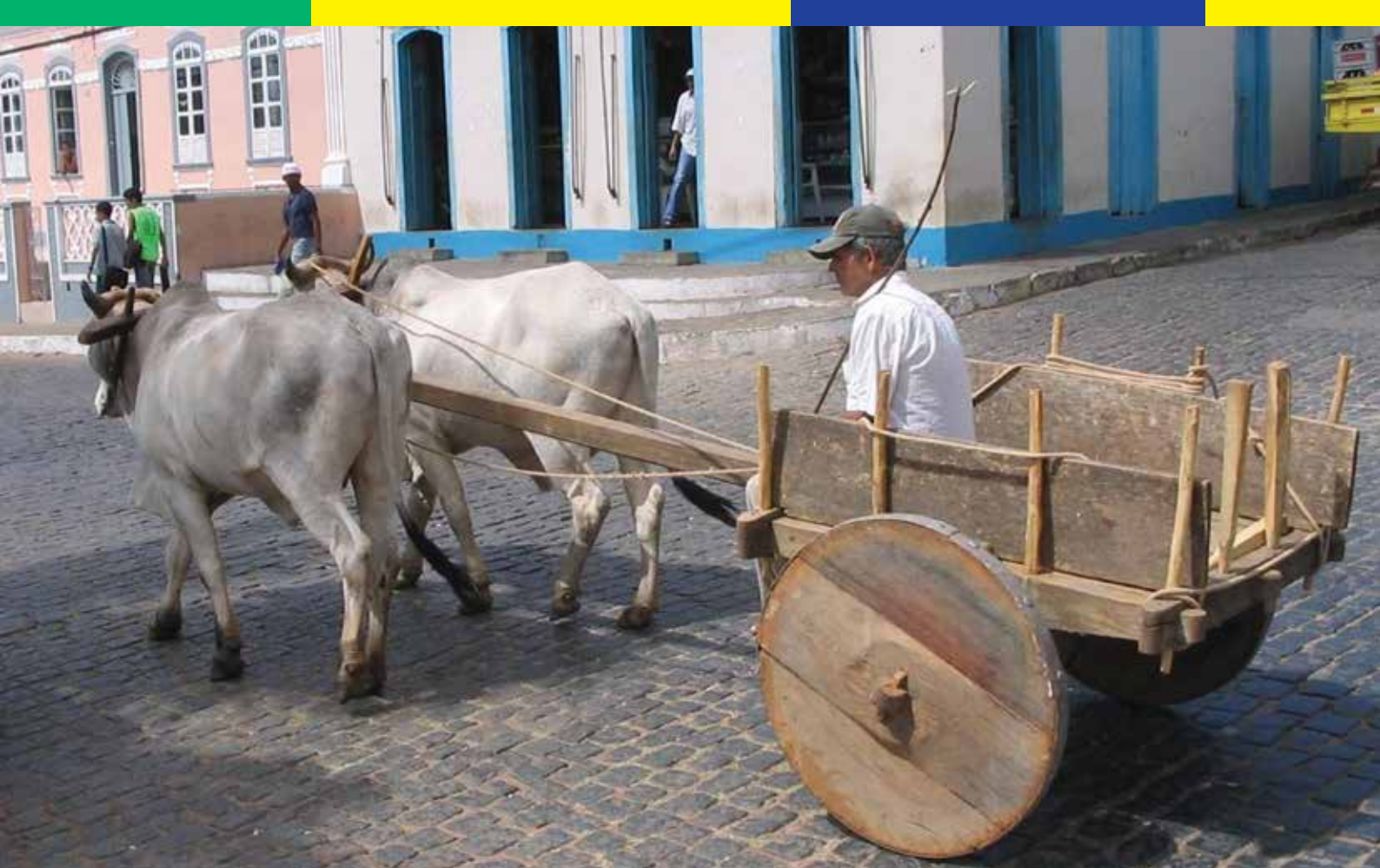
Carro de boi em uma agradável rua da Bahia, Brasil.