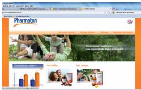
Pharmaton® com Ginseng: Melhor qualidade de vida com Pharmaton®? É o que sugere o website deste produto no Brasil.

Nas propagandas para este medicamento, alega-se também que ele aumenta o desempenho físico e mental: um spot apresentado na televisão brasileira, de 2009, mostra uma mulher que habilmente desvia uma bola de futebol rolando para a rua em frente ao seu carro, ou um homem que - agradece ao Pharmaton® - ao alcançar o metrô no último instante antes de sua partida. 6