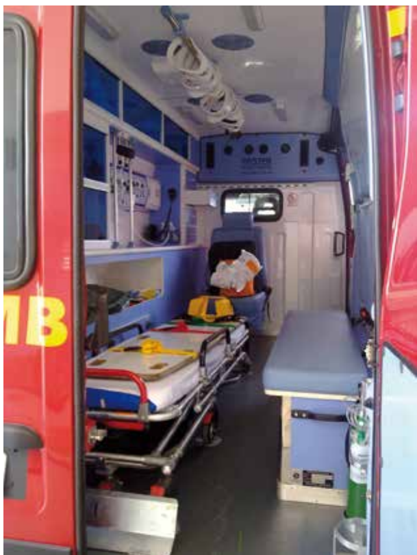
Pacientes com ataque cardíaco dificilmente têm chance para tratamento adequado em Goiás.

têm que comprar os medicamentos em farmácias privadas porque não estão disponíveis nas públicas.” Teoricamente, os medicamentos que constam nas listas positivas do governo e não estão disponíveis em farmácias ou hospitais públicos poderiam ser comprados pelos pacientes em farmácias privadas para posterior reembolso. Este reembolso, contudo, é dificilmente praticado e - de acordo com nossos parceiros brasileiros - frequentemente, os pacientes têm que arcar com os custos nestes casos.