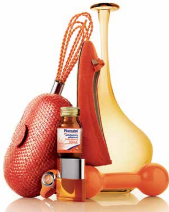
Foto: Pharmaton para mulheres

brasileiros, com métodos questionáveis. Em um folheto informativo da companhia, é oferecida aos consumidores uma considerável redução do preço do medicamento se eles fornecerem seus dados pessoais para a companhia (nome, endereço, número de telefone, nome e número de registro