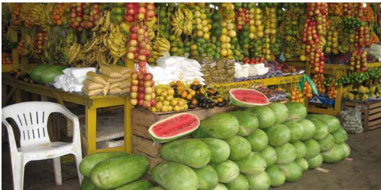
Fruta fresca: muito mais saudável que qualquer mistura de vitaminas.

companhias alemãs que também interrompessem a venda daqueles medicamentos no chamado Terceiro Mundo. A companhia Boehringer Ingelheim então nos informou que continuaria a comercializar suas combinações de dipirona onde “a respectiva autoridade que aprova o registro de medicamentos desejasse, isto após receber todas as informações”. 13 Esta atitude irresponsável não mudou até hoje.