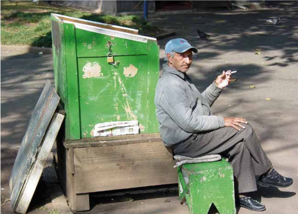
Um homem em uma cadeira de engraxate em Curitiba, Brasil, está esperando por clientes. O sistema público de saúde, financiado por impostos, subsidia a assistência gratuita à saúde dele.