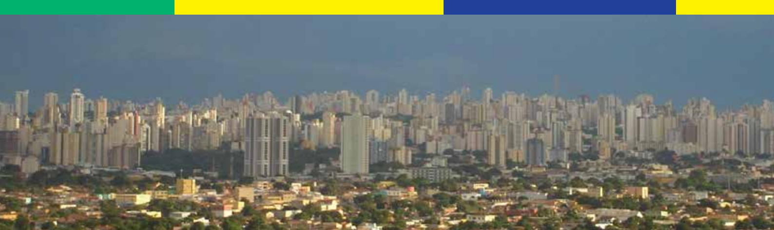
Goiânia é a capital de Goiás. A assistência à saúde não se mostrou melhor do que no Distrito Federal.