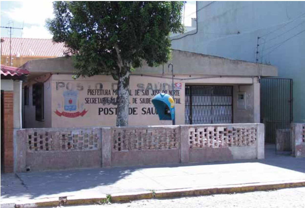
Os postos de saúde são o primeiro ponto de contato dos pacientes.

contribuições sociais das empresas que têm que pagar impostos sobre seus lucros e receitas. No período de 1997 a 2007, foram também levantados recursos por meio da Contribuição Provisória sobre Movimentação Financeira (CPMF). 9 Em 2006, o SUS recebeu apenas 40% da receita da CPMF, pois a maior parte do recurso foi desviada para o pagamento de dívidas públicas. 10