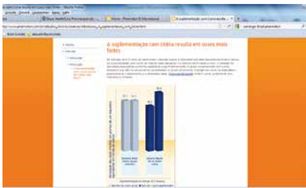
Ossos mais fortes com lisina e Pharmaton® Kiddi? Um estudo realizado em 1962 supostamente prova isso.

“Bayer Para Você”. 3 Além de ser altamente questionável criar incentivos financeiros para a aquisição de medicamentos de marca vendidos sob prescrição, tais práticas também provocam problemas relativos à proteção de dados pessoais. Além disso, a informação da Boehringer Ingelheim sobre o Micardis® deve ser criticada. O texto promocional no panfleto informativo diz que o medicamento oferece proteção cardiovascular. De acordo com a revista alemã Arznei-telegramm , não está suficientemente provado que as “sartanas”, antagonistas dos receptores de angiotensina II - ARA II, previnam incidentes cardiovasculares. 4 A meia-vida da telmisartana, superior a 20 horas, é, ademais, mais longa que o necessário para uma ação por 24 horas. No caso de uma intolerância, a meia-vida estendida seria até desfavorável.