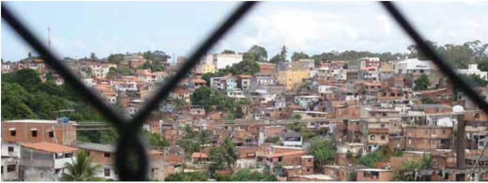
Favela em Salvador. Os elevados custos dos medicamentos limitam o acesso dos pobres a terapias inovadoras.

res da saúde pública, que são responsáveis por tais programas e, adicionalmente, pesquisas nos sítios das companhias na internet e literatura.