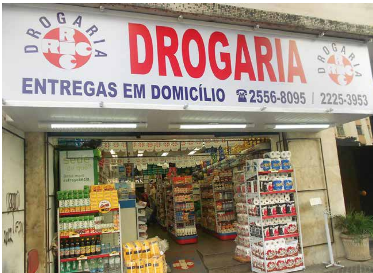
Drogaria no Rio de Janeiro.