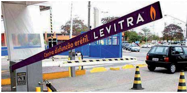
Propaganda para o medicamento contra impotência Levitra.

A Bayer promove de forma veemente seu medicamento contra impotência, Levitra®, no Brasil - principalmente em círculos de especialistas, mas, ocasionalmente, também para pessoas leigas. Poucos anos atrás, propagandas do Levitra® foram encontradas em elevadores e em cancelas de estacionamentos. Tais propagandas para medicamentos que requerem prescrição médica são ilegais no Brasil.