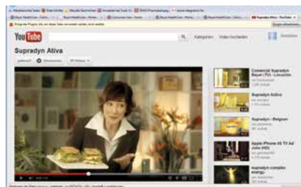
Propaganda da Bayer para o multivitamínico Supradyn®. Mãe e filho almoçam sanduíche e multivitamínico.

O extrato de Ginseng, presente na mistura de vitaminas para adultos, é para reduzir o estresse e a tensão física e mental. Ele também serve para fortalecer o sistema imunológico e para reduzir sintomas de envelhecimento. 7 A Stiftung Warentest (organização alemã de defesa do consumidor), entretanto, adverte que as pessoas com hipertensão arterial ou diabetes deveriam tomar medicamentos contendo Ginseng somente mediante consulta médica. Além disso, estas preparações podem reduzir a ação dos anticoagulantes. 8 Para obter tais informações, os usuários do website do Pharmaton® têm que se esforçar para ler as letras diminutas sob o título “Perguntas frequentes” (FAQ).