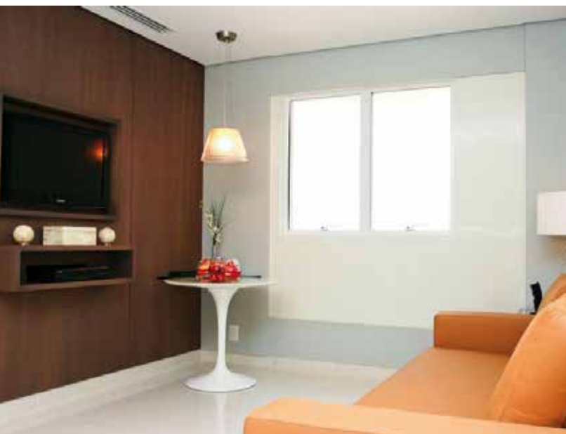
Instalações VIP em um hospital privado em São Paulo.