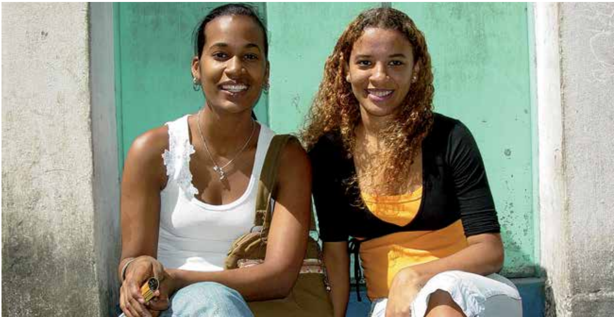
Mulheres jovens em Salvador. Elas estão mal servidas pelas pílulas contraceptivas da Bayer, Yaz e Yasmin.

que sofrem de leucemia é significativamente complicado, uma vez que, para uma parte deles, não há alternativa para o alemtuzumabe. 31