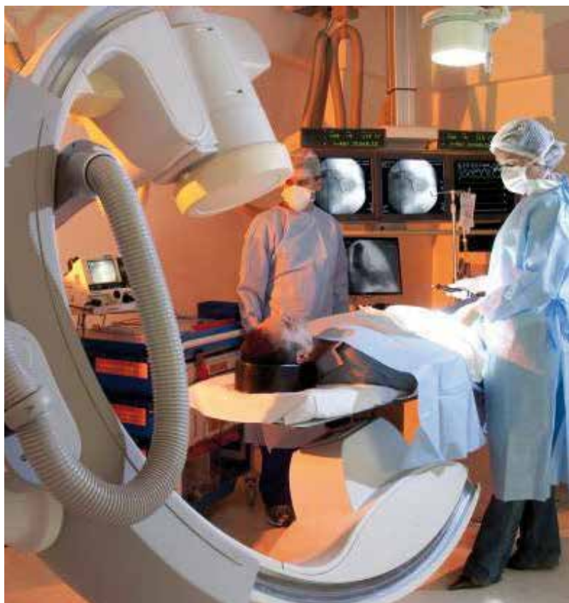
Exames complexos são principalmente realizados em clínicas privadas, pois, em geral, equipamentos mais sofisticados não estão disponíveis em instituições públicas.

Como consequência, frequentemente, os pacientes preferem o sistema privado ao público (SUS), mas fazem uso deste, tardiamente, quando o sistema privado se torna inacessível. Alguns pacientes têm plano de saúde privado, mas vão para o SUS para obter seus medicamentos, pois de outra forma teriam que pagar por eles no setor privado. Um paciente relata: "Embora eu tenha um plano de saúde privado, eu obtenho a maioria dos meus medicamentos via SUS, pois eu não tenho condições de pagar por eles. Eu acho um absurdo ter que pagar por nossos medicamentos ainda que tenhamos um plano de saúde."