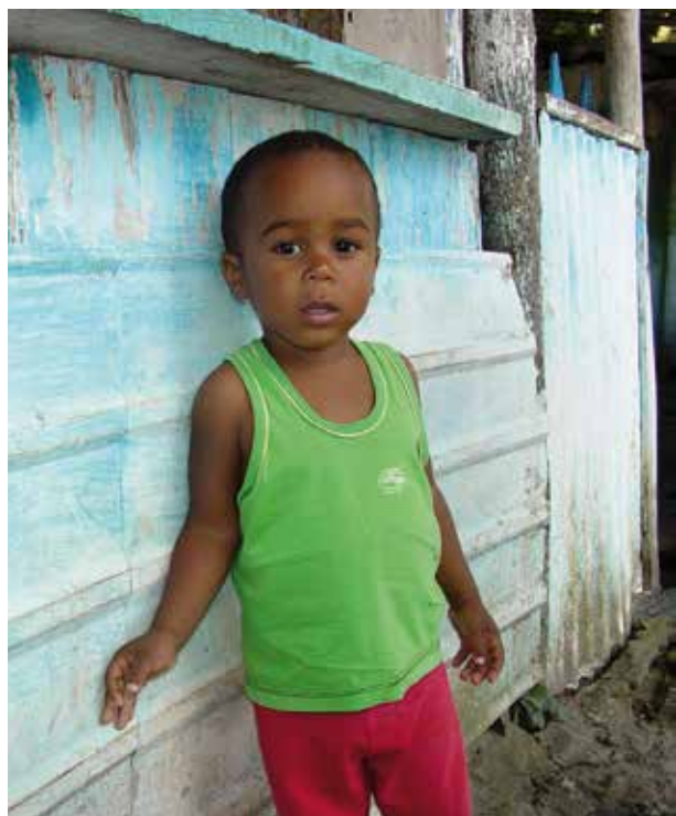
Mais de um quarto da população brasileira é composto de crianças.

Tomando apenas os índices bem distintos de mortalidade infantil de duas das regiões como indicadores das grandes diferenças em cuidados à saúde, tem-se que: no sul do país, morrem cerca de 13 crianças por 1.000 nascidos-vivos, enquanto 23 bebês no norte não vivem para ver seu primeiro aniversário. 4