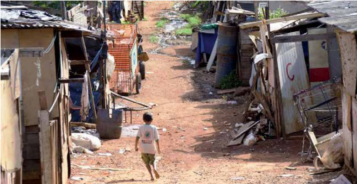
Pessoas pobres – não é o foco do portfólio das companhias farmacêuticas Boehringer Ingelheim, Baxter e Bayer.

doença de Parkinson. No entanto, consideramos problemático que o fabricante o ofereça também para o tratamento da síndrome de pernas inquietas no Brasil (também é o caso na Alemanha). 7 O Sifrol® pode causar graves efeitos adversos, como comprometimento da visão. 8 Também são muito comuns a vertigem e incontáveis ataques de sono com quedas súbitas, enquanto acordado, durante atividades cotidianas como condução de automóvel. Edema, náusea, dificuldade de pensamento e de locomoção, e distúrbios de comportamento ocorrem frequentemente. Além disso, há apenas fraca evidência sobre a eficácia do pramipexol com relação à síndrome das pernas inquietas: o pramipexol produziu apenas leve vantagem adicional, comparado a placebo, em um ensaio clínico com duração de 12 semanas. As queixas podem ser até pioradas com o uso de pramipexol. 9 Não estão disponíveis dados de longo prazo e estudos comparativos com outros fármacos.