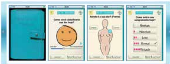
Para instalar o aplicativo

Os médicos também são cortejados: de acordo com informação da Bayer, há mais de 600 representantes no Brasil com a tarefa de familiarizar os médicos com os medicamentos desta companhia que requerem prescrição, tais como anticoncepcionais ou hormônios para homens. Os prescritores são visitados mensalmente. 9