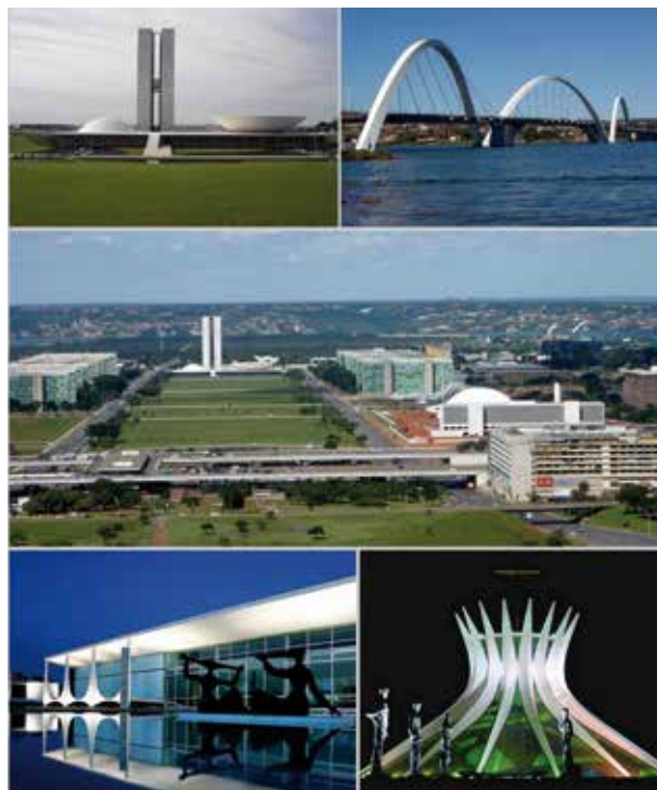
A capital Brasília, no DF, oferece arquitetura moderna e relativamente boa assistência à saúde.

Em seis dos dez hospitais públicos examinados, foram encontrados somente seis dos